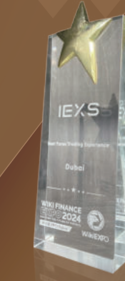
Pengalaman Trading Forex Terbaik

Pada Januari 2023, IEXS Securities memenangkan penghargaan dari otoritas industri - "Broker Fintech Forex Terbaik di Asia untuk tahun 2022". Kami menonjol sebagai merek pemenang dalam nominasi ini dengan teknologi perdagangan yang kompetitif dan layanan pelanggan kelas dunia.