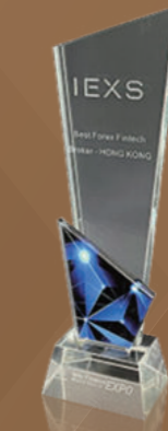
Broker Fintech Forex Terbaik di Asia

Pada September 2021, IEXS dianugerahi penghargaan "Broker Fintech Forex Terbaik di Eropa untuk tahun 2020". Penghargaan ini diberikan setelah analisis komprehensif terhadap perusahaan-perusahaan berkinerja terbaik di berbagai pasar dan merupakan salah satu evaluasi tahunan paling otoritatif dan berpengaruh di industri ini.